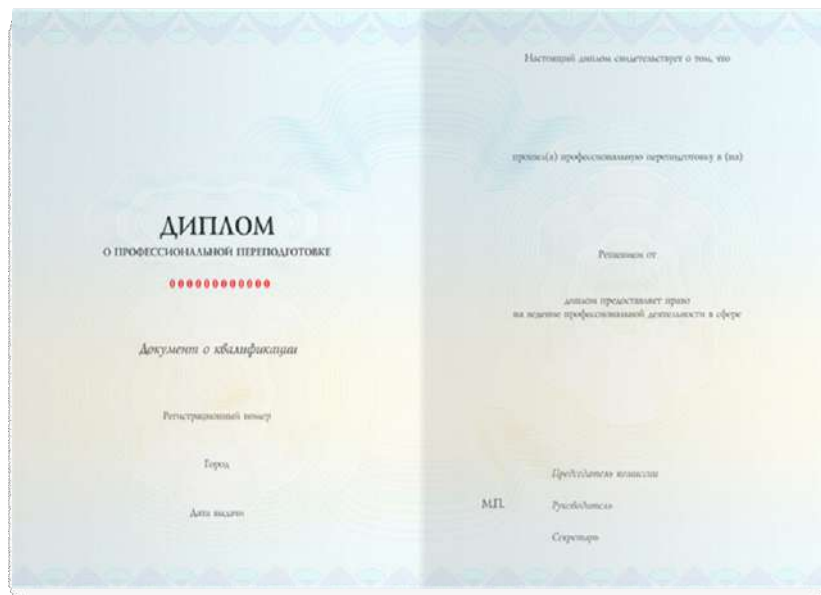
Диплом о профессиональной переподготовке