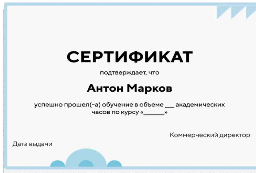
Сертификат о прохождении обучения